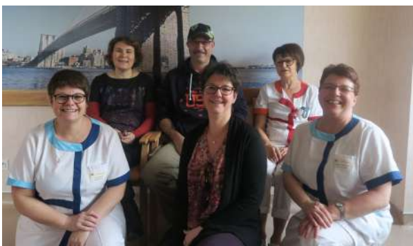
Ils sont présents depuis 25 ans !