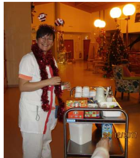
Réveillon de Noël